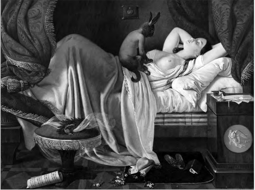
Рис. 1.3. Ditlev Blunck. Ночной кошмар. 1848 г.

в том числе голосовая складка, но состояние сна либо еще не наступило, либо уже закончилось. Как правило, это происходит при положении тела на спине или животе; спящий думает, что проснулся, но при этом не владеет своими членами, находится в темном и сумеречном, но знакомом пространстве. Довольно часто он ощущает, как будто нечто садиться на него верхом или охватывает ногами, начинает давить или душить, но не может ничего поделать, даже если рядом с ним на постели находится близкий ему человек, спящий беспробудным сном (рис. 1.3). Он ощущает необычайное одиночество в своем положении, но через некоторое время выходит из этого состояния с чувством глубокого страха, иногда – отвращения к напавшим на него существам, весь покрытый потом. Состояние сонного паралича известно практически всем людям. С регулярностью оно может сопровождать