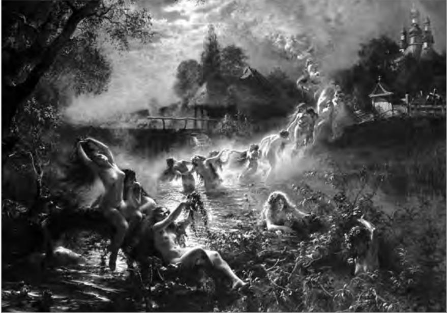
Рис. 1.2. К.Е. Маковский. Русалки, вылавливающие дрему и уходящие из мира яви (фрагмент). 1879 г.

об особом состоянии транса, предшествующем сну, но не обязательно к нему приводящему. В индийской и тибетской йоге сновидений, а так же в практиках сна в авраамических религиях, этому состоянию уделяется огромное внимание, так как пребывание в нем может быть с сохранением осознанности, например, при чтении мантр или соответствующих молитв. В этом случае они становятся опорой для сознания при отделении себя, как самости, от потока мыслеформ, что является обязательным для сохранения осознанности и в сновидении, о чем подробно шла речь в двух первых книгах.