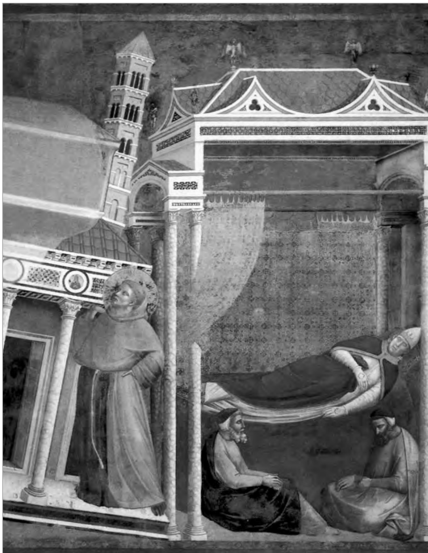
Рис. 1.4. Джотто ди Бондоне.

Явление во сне Папе Римскому Иннокентию III Святого Франциска, поддерживающего церковь.