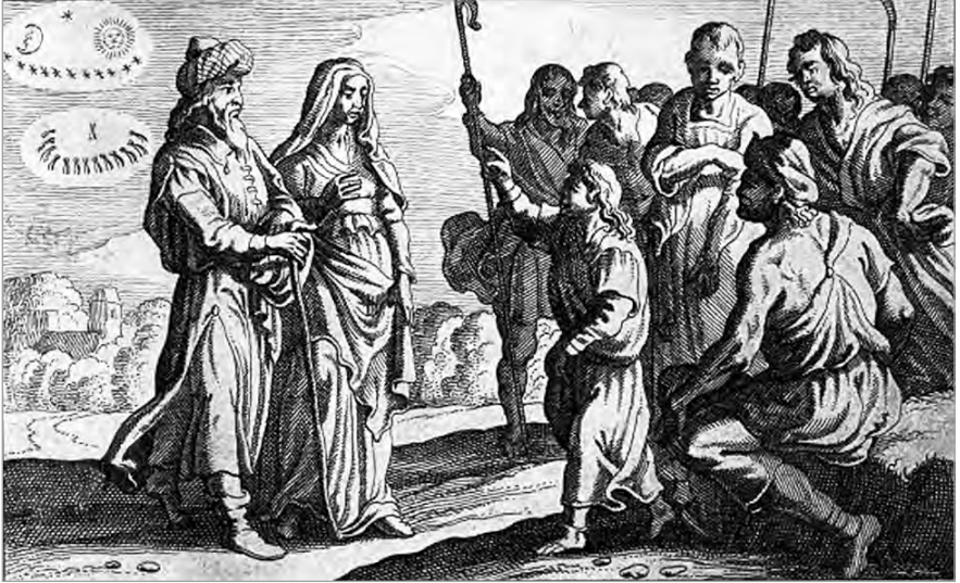
Рис. 1.2. Иосиф рассказывает о своем сне. Питер Схют. «Библейская история», 1659 г.

И сказали ему братья его: неужели ты будешь царствовать над нами? Неужели будешь владеть нами? И возненавидели его еще более за сны его и за слова его.