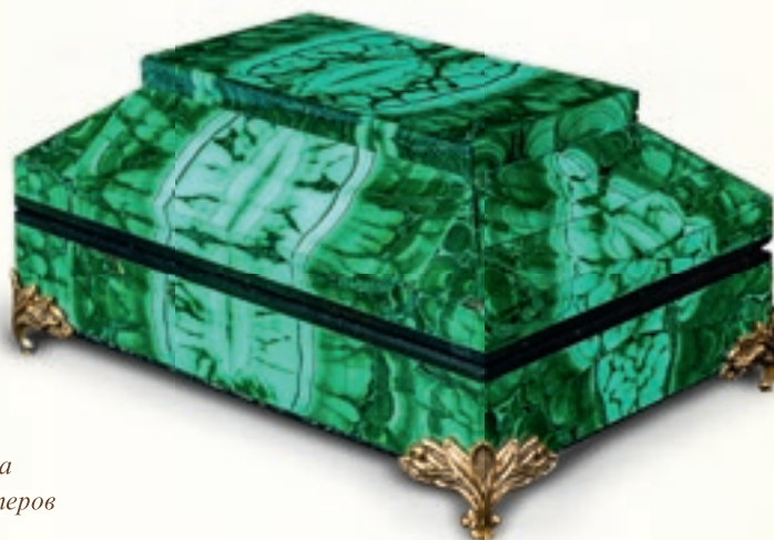
Малахитовая шкатулка работы уральских мастеров

Основная цель этого издания – показать читателям богатый и волшебный мир минералов, пробудить интерес к познанию своего потенциала и раскрытию его граней через исследование камней, соприкосновение с их энергией. Для меня все камушки живые, обладают индивидуальным сознанием и предназначением. Если вам такой подход близок, то эта книга для вас.