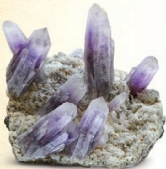
Кристаллы аметиста на подложке. Герреро, Мексика

держивают и подходят мне, учитывая специфику моего рода занятий. А есть минералы требовательные, капризные, со сложным характером и своими особенностями, поэтому с ними имеет смысл контактировать точно – с запросом на проработку определенной сферы и с готовностью принимать все последствия этого взаимодействия. С ними требуется большая степень концентрации и осознанности, чем с другими камушками. Вот и вся разница. Могу сказать, что среди камней, описанных в этой книге, моему предназначению наиболее созвучен аметист – ему и посвящена самая объемная глава.