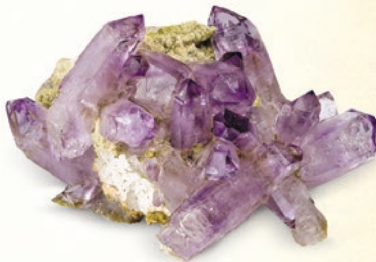
Кристаллы аметиста на подложке. Веракрус, Мексика. Weinrich Minerals, Inc.

Задача книги – познакомить читателей с магическими свойствами минералов. Я выбрала для нее именно те камушки, которые обладают интересными, полезными и востребованными свойствами. И при этом довольно распространенные и доступные по цене – такие, которые несложно найти и приобрести, хоть в украшениях, хоть в природном виде. Конечно, осталось много любимых мною минералов, не менее уникальных и сильных, которые не вошли в эту книгу: например, рубин, родолит, кианит. Я их очень ценю и часто с ними взаимодействую, просто в этот раз речь пойдет не о них. Это повод для продолжения книги: камни с особенными свойствами, требующими более серьезных эзотерических знаний и опыта, а также редкие или эксклюзивные я оставила на потом.